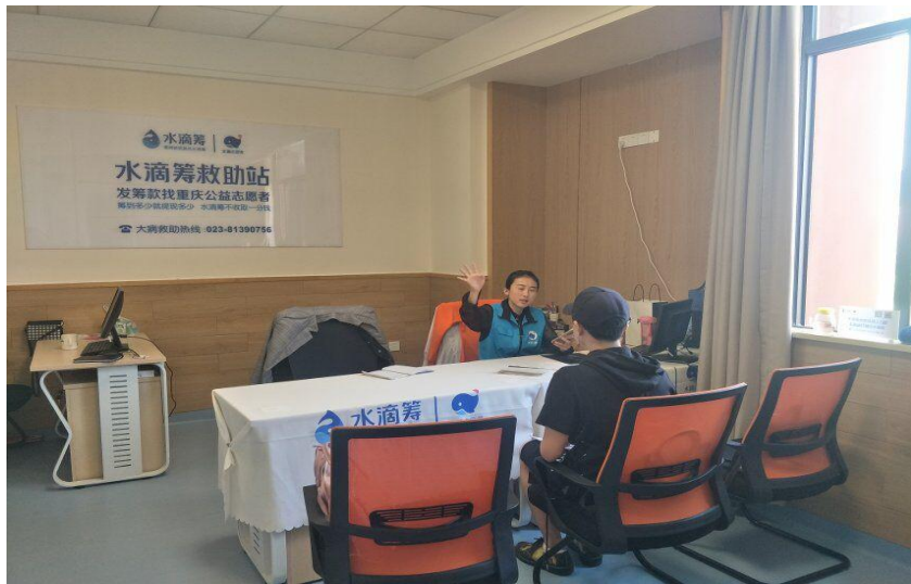
● 重庆大学“法理两全”社会实践团小组成员前往水滴筹首个实体站调研。