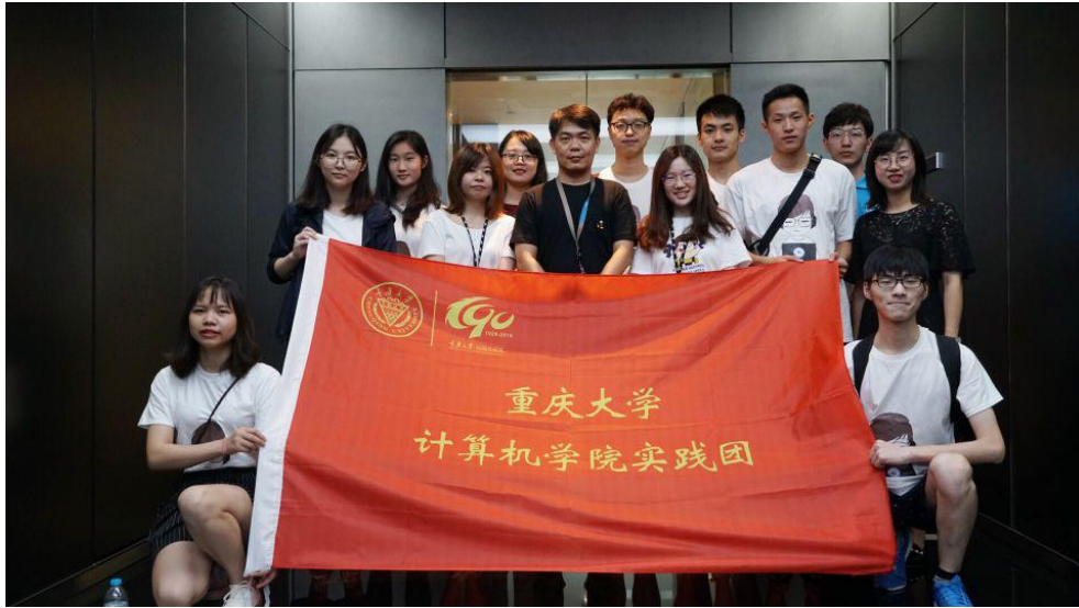
● 重庆大学“厚植重大情，共筑重大梦”实践团与花旗校友合影。