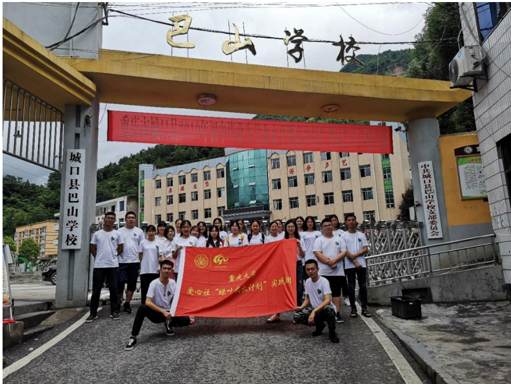
● 重庆大学“绿叶成长计划”实践团巴山支教队抵达支教地点。