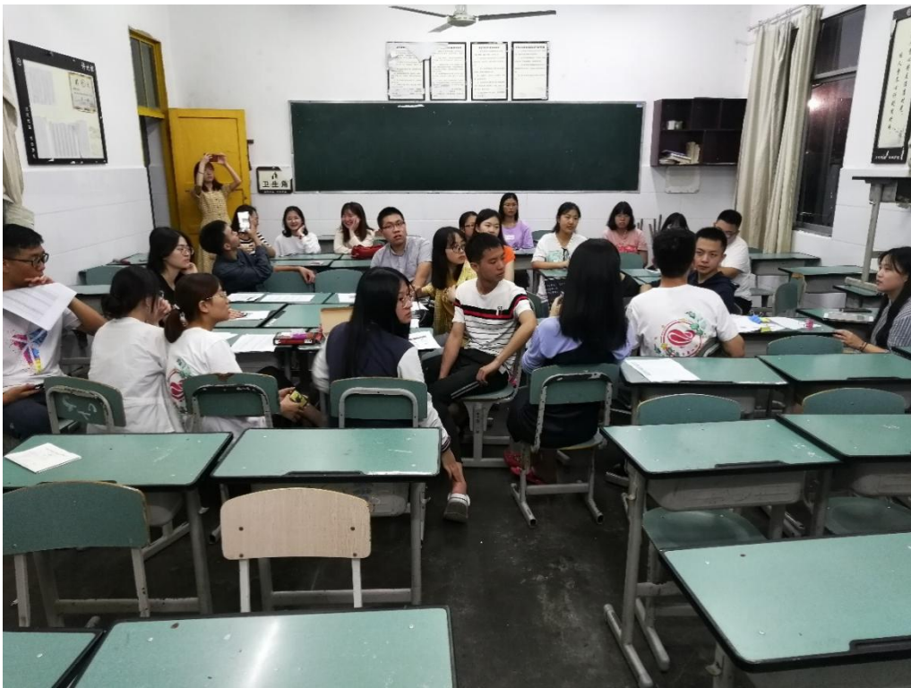
● 重庆大学“绿叶成长计划”实践团巴山支教队17日第二次队内会议。