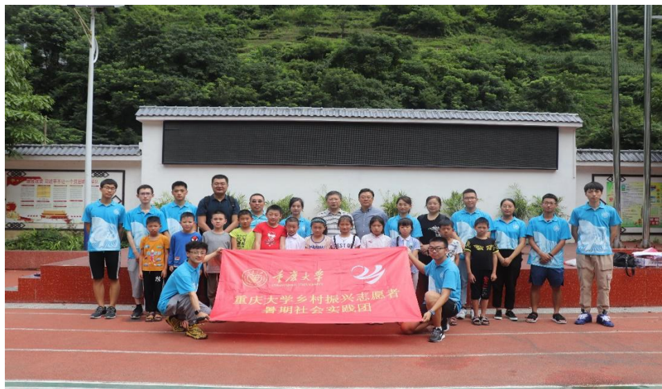
● 重庆大学 “乡村振兴志愿者” 实践团成员、天元小学同学与领导合影。