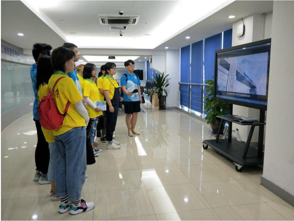
● 重庆大学“巴蜀材人”实践团参观宝钢湛江钢铁有限公司管控中心。