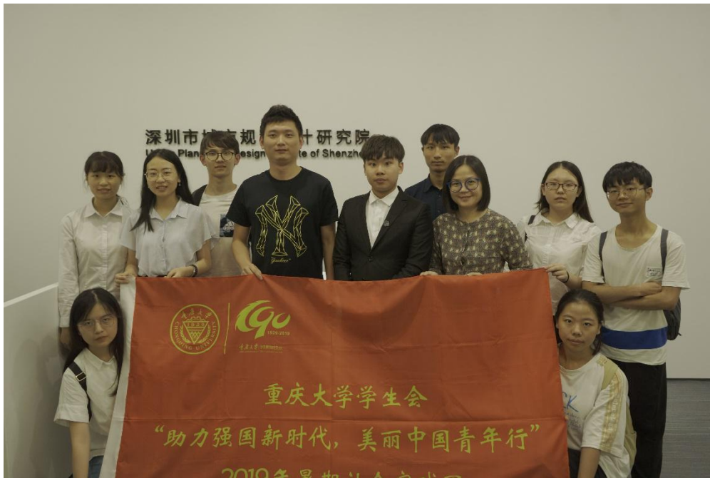
● 重庆大学 “助力强国新时代，美丽中国青年行” 实践团成员在深圳市城市规划设计研究院前合影。