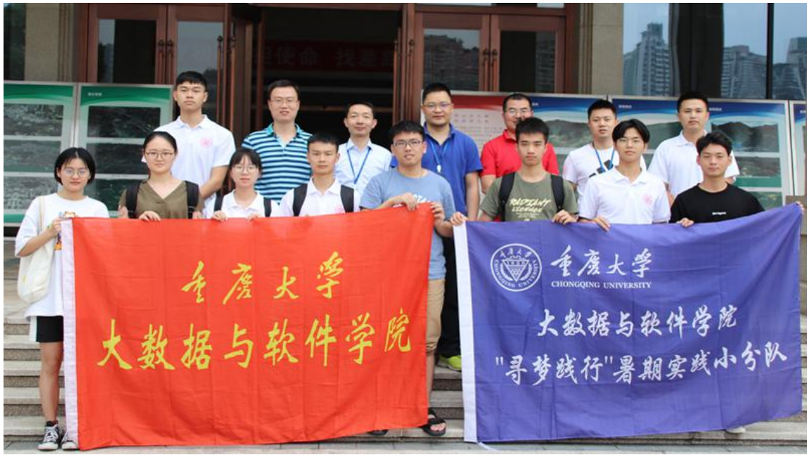
● 重庆大学 “寻梦践行”实践团走访重庆市勘测院。