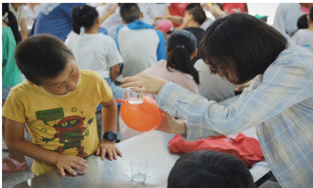
志愿者带领小朋友共同探索科学实验。