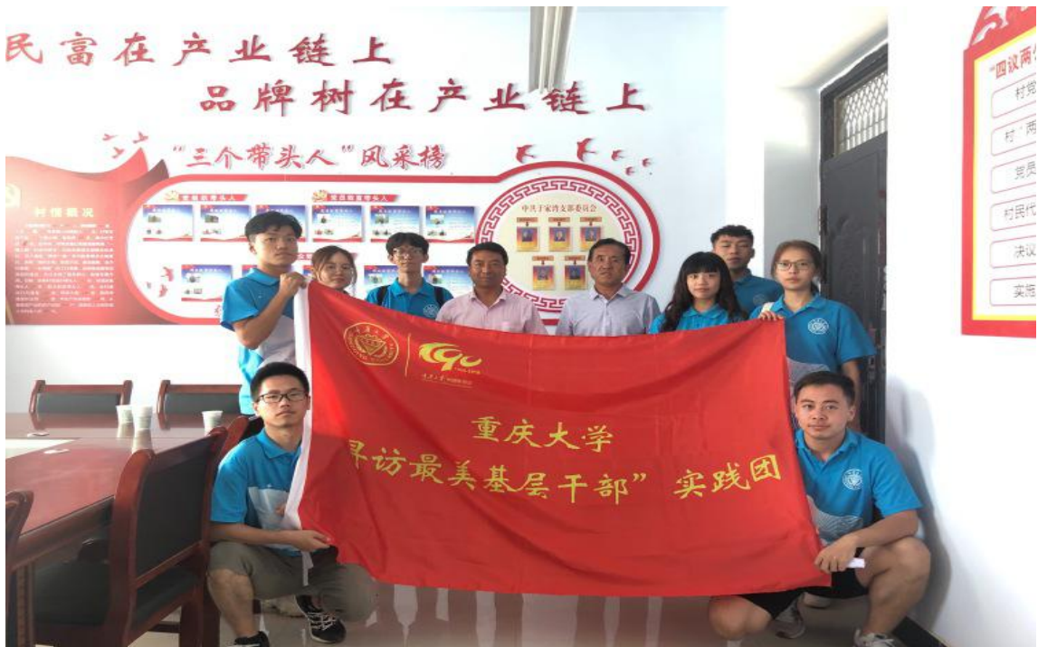
● 重庆大学 “寻访最美基层干部”实践团抵达涪川县。