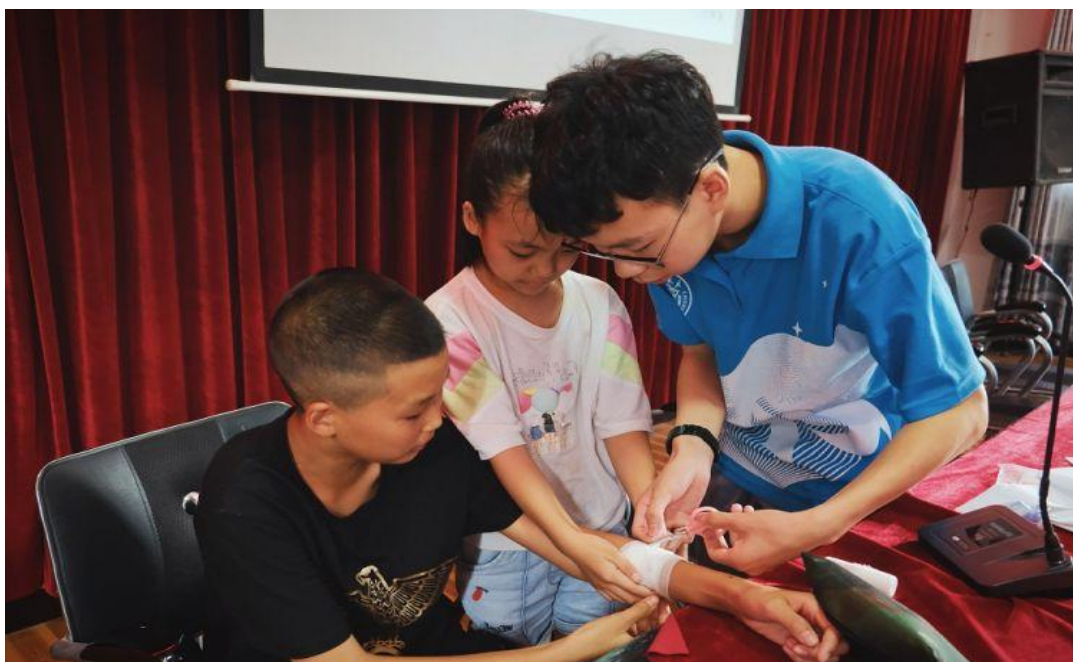
图为志愿者教授小朋友绷带使用方法。