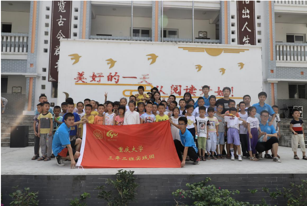
● 重庆大学“三年二班”实践团成员与小朋友合影。