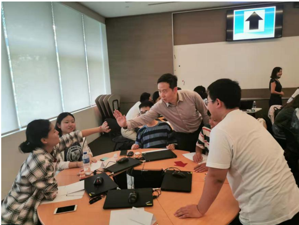
● 重庆大学“一带一路”实践团成员受到教授的击掌鼓励。