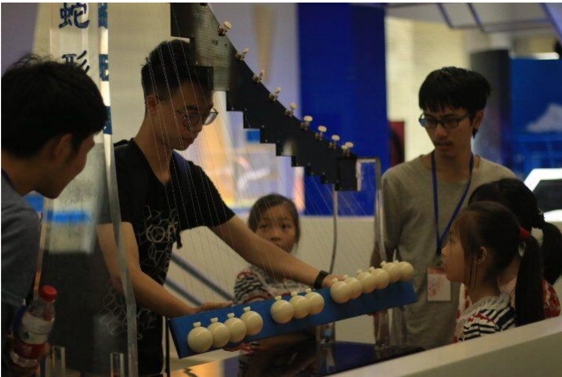
图为志愿者和小朋友参观重大科技馆

“重大一日游”已经连续举办四年。参与“重大一日游”的对象是“向日葵儿童关爱计划”的小朋友和唐仲英爱心协会的志愿者。本活动旨在让小朋友和志愿者有更深接触，方便开展教学工作，同时宣传这项活动，让更多的志愿者参与其中，也让唐协帮助更多的小朋友。