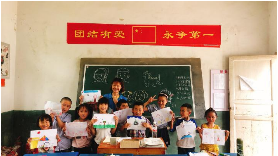
● 重庆大学 “自心筑梦” 支教实践团与梨山小学学生的合照。