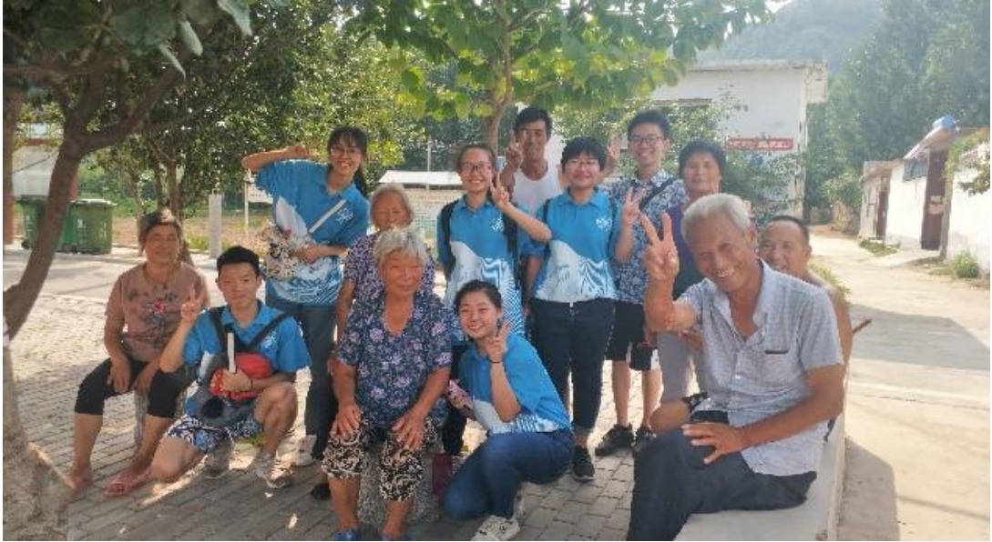
● 重庆大学 “探寻儒家文化” 实践团与圣源村村民的合照。