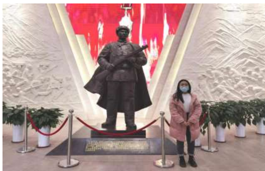
● 重庆大学校团委学生社团中心“学四史·守初心·担使命”实践团成员与邱少云烈士塑像合影留念