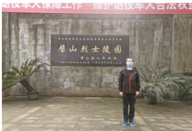
● 重庆大学校团委学生社团中心“学四史·守初心·担使命”实践团成员在烈士陵园题匾前拍照留念