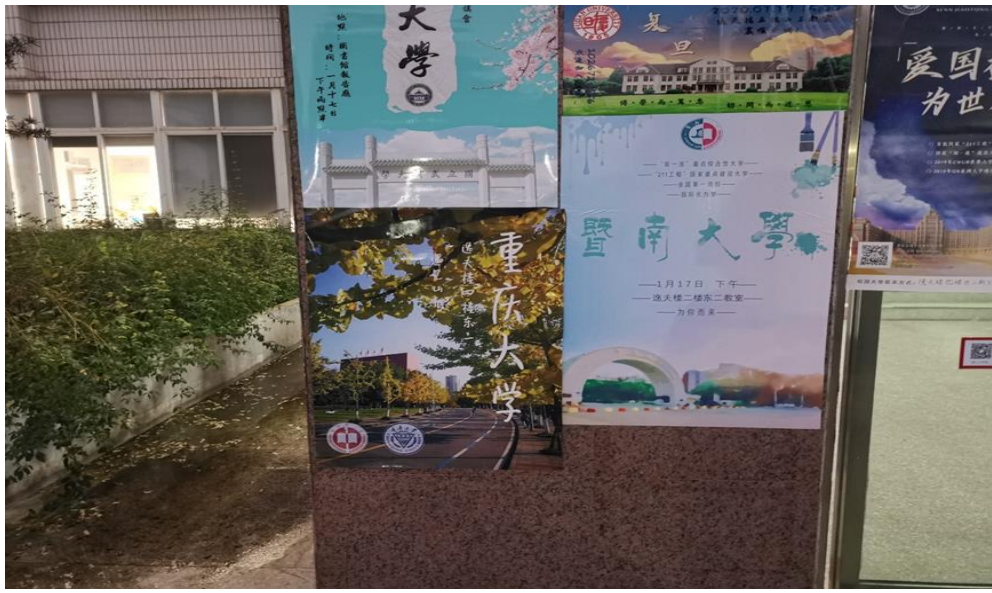
● 重慶大學“憶母校情，訴重大事”社會實踐團隊在宣講前在教學樓處粘貼好的海報