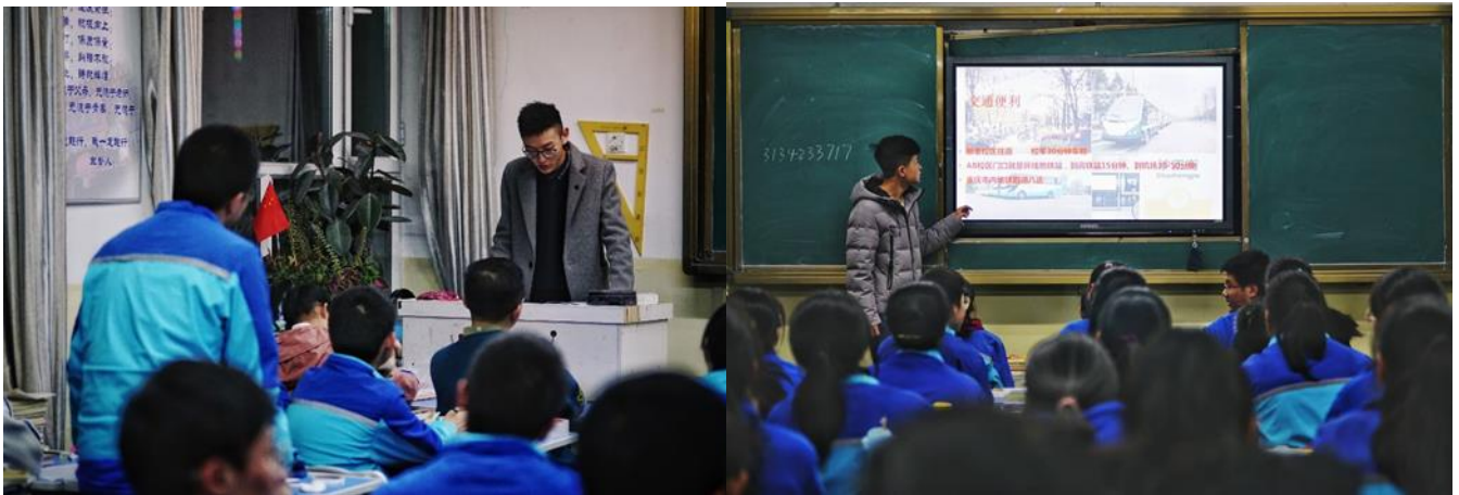
● 張掖市招生宣講團在張掖市第二中學進班宣講