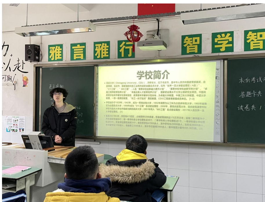
● 重庆大学“恒川”实践团在为同学们进行重庆大学的初步介绍