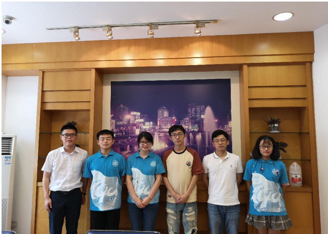
● 重庆大学“助力强国新时代，美丽中国青年行”社会实践团上海分队前往上海老港固废综合处置基地的上海生活垃圾科普展示馆进行参观。