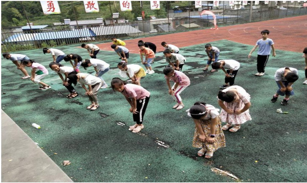
● 重庆大学“绿叶成长计划”实践团成员与小朋友上体育课。