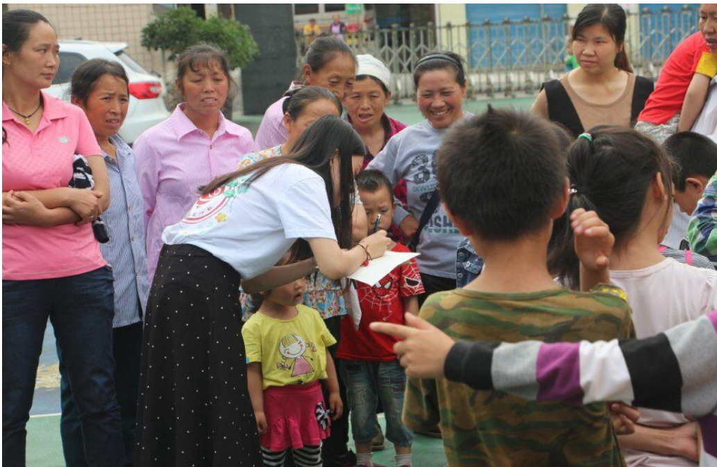
● 重庆大学“绿叶成长计划”实践团成员在与小朋友交流。