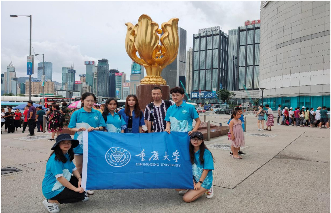
● 重庆大学“先锋青年·筑梦港澳”实践团参观“永远盛开的紫荆花”雕塑。