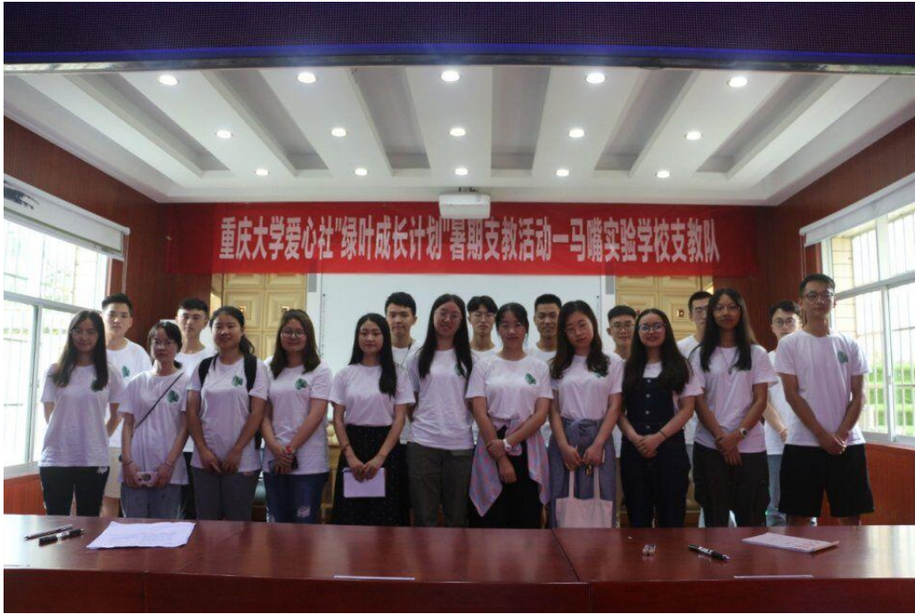
● 重庆大学“绿叶成长计划”实践团成员参加启动仪式。