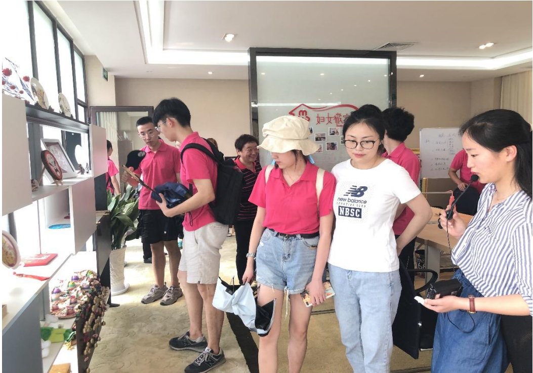
● 重庆大学 “赴江苏盐城美丽中国” 实践团在恒北村参观展馆。