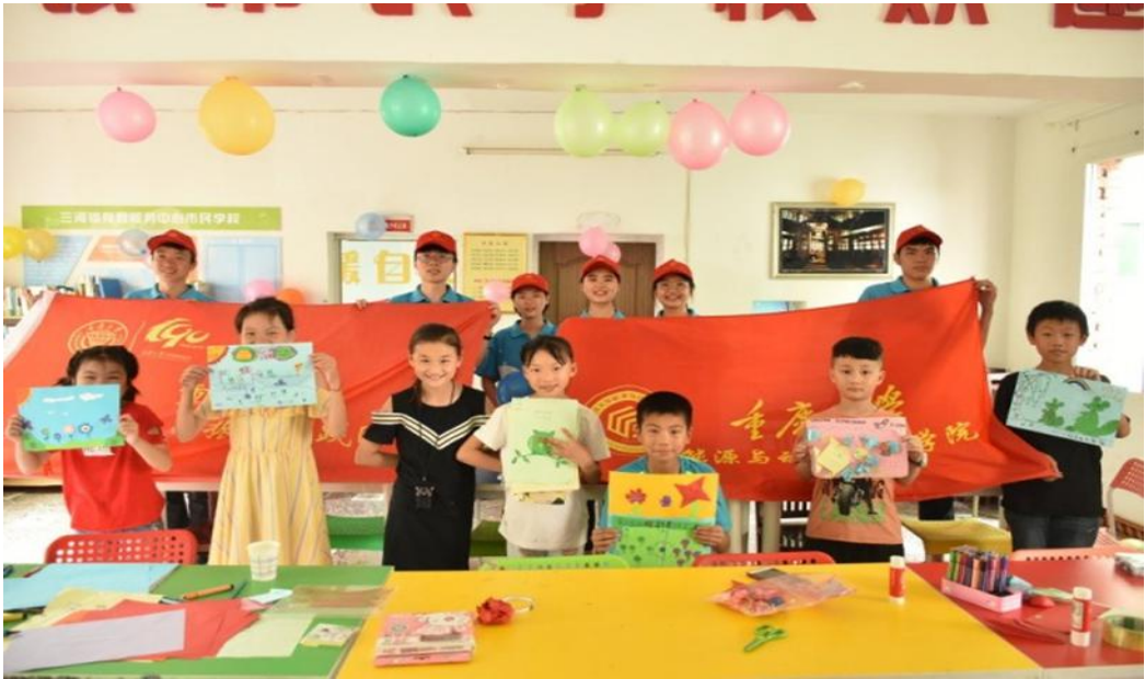
● 重庆大学 “乡村振兴” 实践团与喜洋洋社会工作服务中心联合开展的“放飞梦想，展望未来”七彩假期活动在石柱县三河镇文化活动。