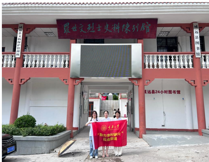
●重庆大学外国语学院“让梦想飞进大山”实践团在罗世文烈士史料陈列馆外合影