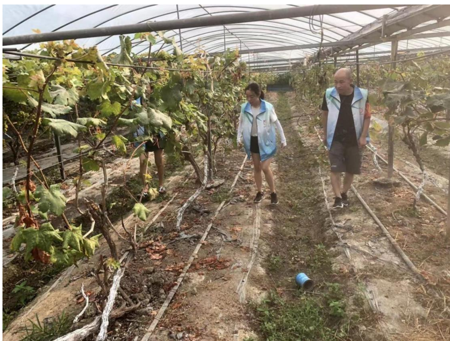
●重庆大学“百子挂职”实践团成员跟随社区工作人员调研社区承包农田种植葡萄情况