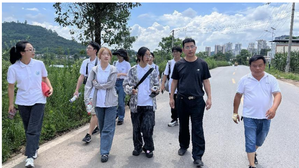
●重庆大学管理科学与房地产学院“寻乡筑梦”实践团随和平新村第一书记在村中走访