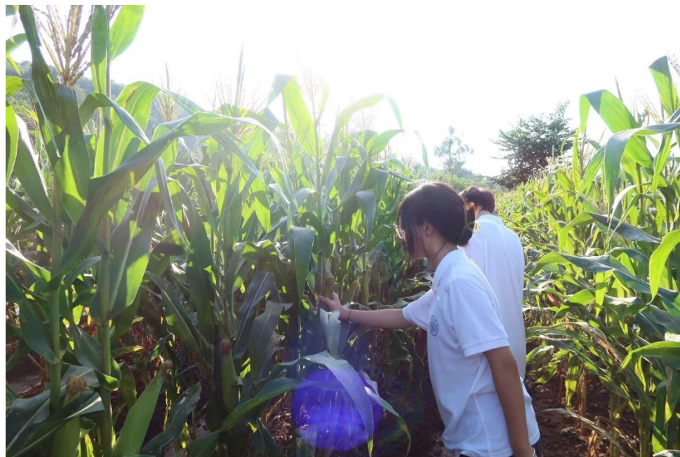
●重庆大学管理科学与房地产学院“寻乡筑梦”实践团在稻田+特色项目中体验摘玉米