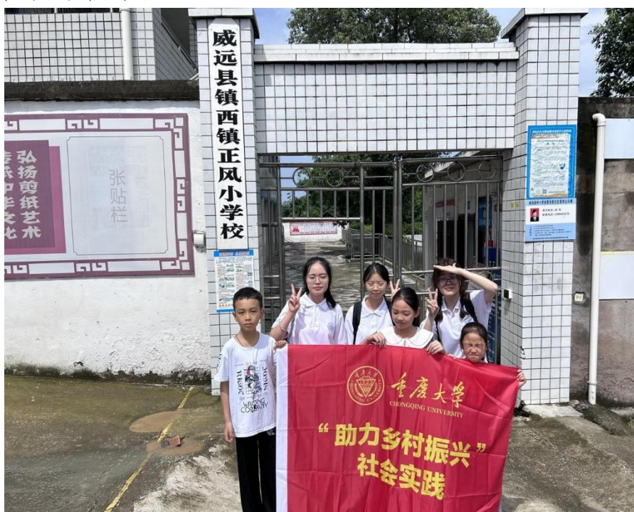
●重庆大学外国语学院“让梦想飞进大山”实践团成员与威远县镇西镇正风小学同学合影