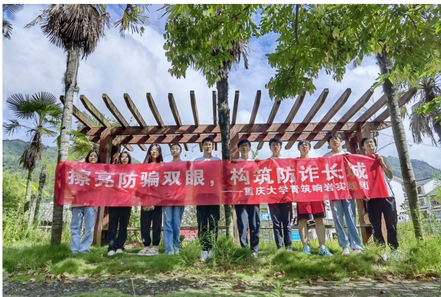
●重庆大学“青筑响岩”实践团进行反诈宣传活动合影