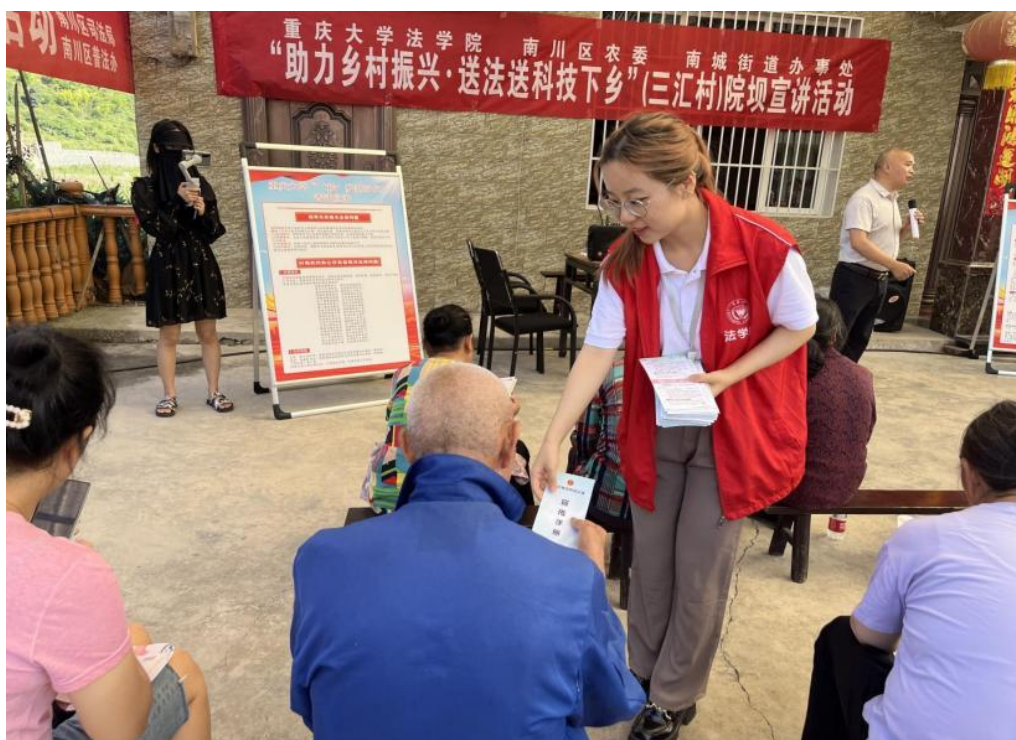
●重庆大学法学院“‘援’梦新时代”实践团为三汇村村民发放普法宣传册