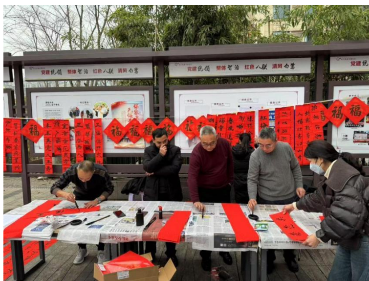
★ 重庆大学本科生院“红叶云阳”实践团邀请社区老人写对联