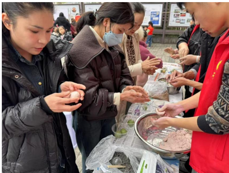
★ 重庆大学本科生院“红叶云阳”实践团与社区群众一起包汤圆